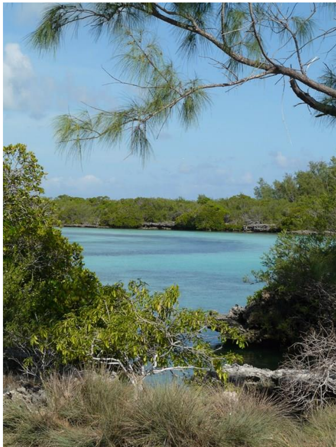
Une vue d'Aldabra

Il y a indubitablement urgence et la mise en protection de plus d'espaces marins et côtiers, la création de plus d'aires marines protégées donc, nous aidera certainement. Mais il faudra bien plus pour inverser la trajectoire toxique sur laquelle nous sommes engagés. Cette NAPA rapporte quelques initiatives conduites à une échelle locale pour y répondre. Pourvu qu'elles se multiplient dans l'avenir... plus vite que les déchets eux-mêmes !