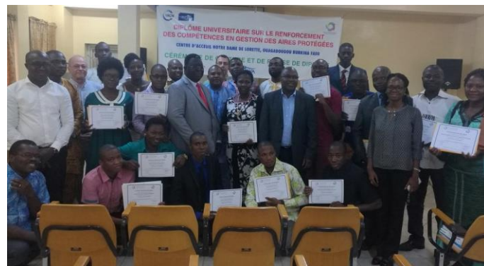
La treizième promotion lors de la cérémonie de clôture

Le prochain DU, c'est en avril 2018 ! La campagne d'inscription sera lancée en octobre prochain.