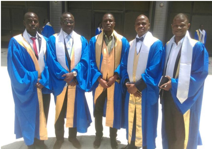
Les cinq boursiers du Papaco/MAVA lors de la cérémonie de remise du diplôme de master à Alexandrie