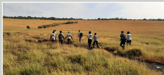
Supervision de l'équipe féminine de surveillance dans la zone de gestion de Dara