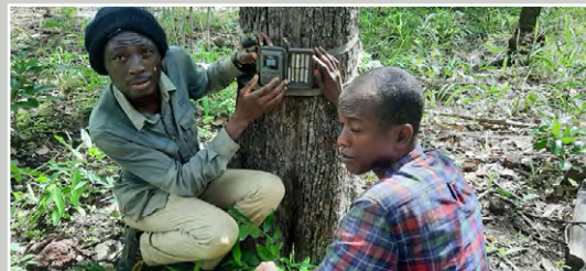
Entretien de caméras pièges dans le Bakoun