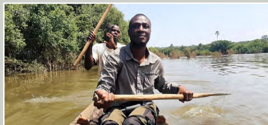
Navigation sur le fleuve