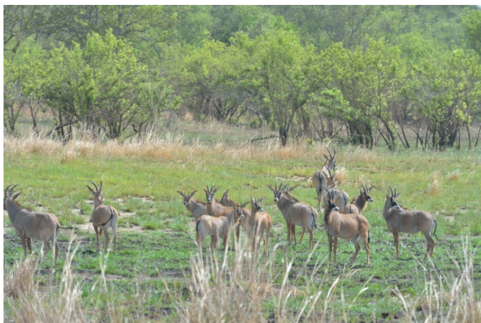
Hippotragus equinus koba

Le gouvernement du Burkina Faso vient donc d'officialiser la création du Parc National d'Arly d'une superficie de 217 950 ha à travers l'adoption d'une loi, en juillet dernier, qui fut promulguée par décret du Président du Faso le 27 juillet 2015. Cela a été possible grâce à l'adhésion des communautés locales des trois communes riveraines (Logobou, Tambaga et Madjoari) qui ont participé activement aux différentes consultations villageoises pour définir les limites du parc et les droits d'usage qui leur sont reconnus.