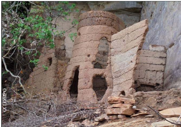
Anciens greniers au flanc de la falaise Gobnangou

elles-mêmes créées respectivement en 1954 et en 1970.