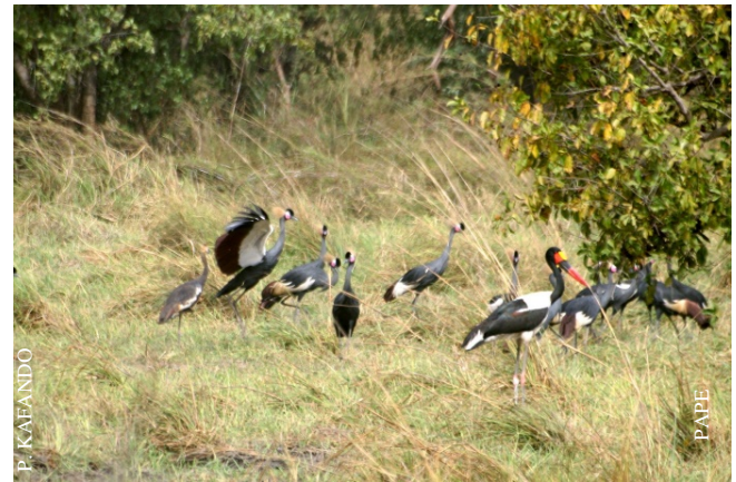
Association de Grues et Jabiru

le parc ait son acte de naissance. Il n'est jamais tard pour bien faire et il était temps.