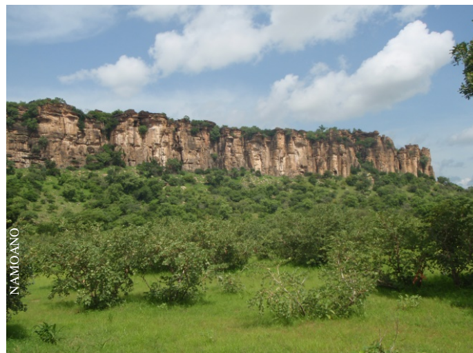
Falaise Gobnangou à l'intérieur du parc

Au Burkina Faso, s'il y a une entité naturelle qui est bien connue, tant au niveau national qu'international, c'est bien le parc d'Arly, connu de par sa géographie, sa géologie et bien évidemment sa diversité floristique et faunistique.